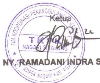
NY. RAMADANI INDRA SAPUTRA

Demikian permohonan ini disampaikan, atas partisipasinya diucapkan terima kasih.