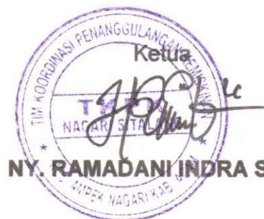
NY. RAMADANI INDRA SAPUTRA

Demikian permohonan ini disampaikan, atas partisipasinya diucapkan terima kasih.